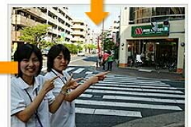
モスバーガーを右折です。

※参加人数に限りがございますので、お申し込みの先着順に優先的にご参加頂けます。(最大60名定員)