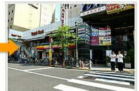
ミスタードーナツを右手にして直進してください。