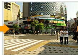
階段を下りたらドトールコーヒーを左折