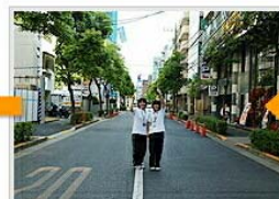
クジラが目印です。