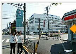
信号を渡ったら到着です。