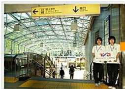
西葛西駅南口が出口です。